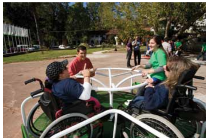
Juegos inclusivos en Parque Rivera.

Las propuestas presentadas en 2013 serán difundidas por RAMPA en cuanto termine el estudio de su viabilidad. Se puede realizar un seguimiento del proceso en la página web http://www.presupuestoparticipativo.montevideo.gub.uy .