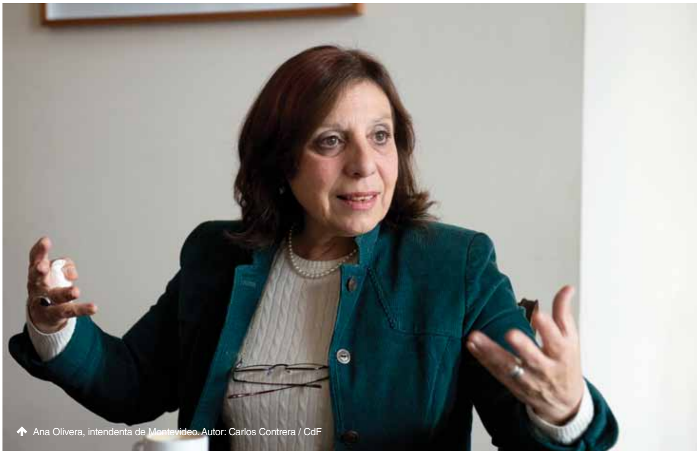
↑ Ana Olivera, intendenta de Montevideo.

Hace pocas semanas, la Intendencia lanzó una campaña de convivencia –llamada Montevideo Convive– que según se señala en la página web, “busca promover actitudes cívicas y la preservación del espacio público como un lugar de convivencia, en el que todas las personas puedan desarrollar sus actividades de libre circulación, de ocio, de encuentro y de recreo, en armonía y respeto por los derechos de los demás”. A propósito de este tema dialogamos con la intendenta de Montevideo sobre las acciones que está llevando adelante el gobierno departamental para efectivizar esa convivencia de todos y todas.