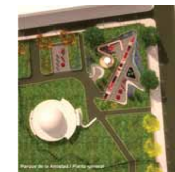
Proyección del Parque de la Amistad. Autor: Arq. Marcelo Roux