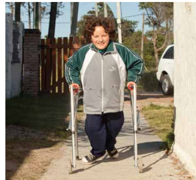
Niño con discapacidad motriz.

En Uruguay cerca de 50.000 niños, niñas y adolescentes viven con alguna discapacidad, esto representa 9,2 por cien-