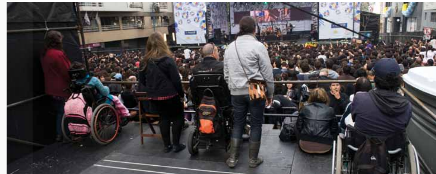
↑ Tarima para personas con discapacidad en los espectáculos del Bicentenario.

Este decreto surgió de la Comisión de Accesibilidad de la Junta Departamental de Montevideo, la cual integra la edila