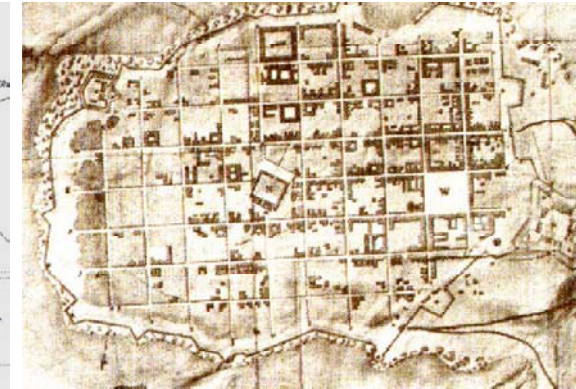
PLANO 4 | 1785 AUTOR: JOSÉ DEL POZO