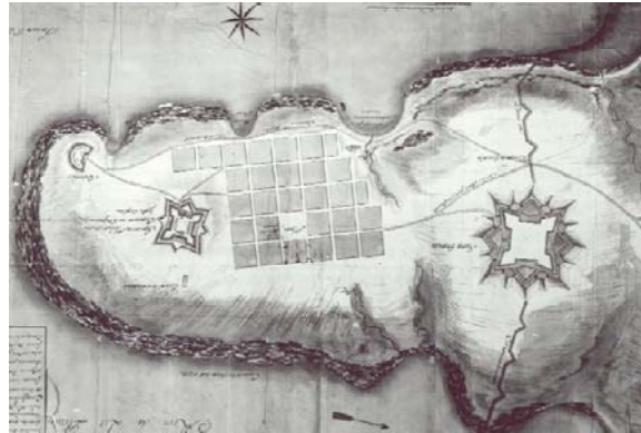
PLANO 2 | 1730 AUTOR: FRANCISCO PETRARCA TRAZADO INICIAL Y UBICACIÓN ORIGINAL DE FORTIFICACIONES, FUERTE VIEJO, FUERTE SAN JOSÉ Y CIUDADELA.