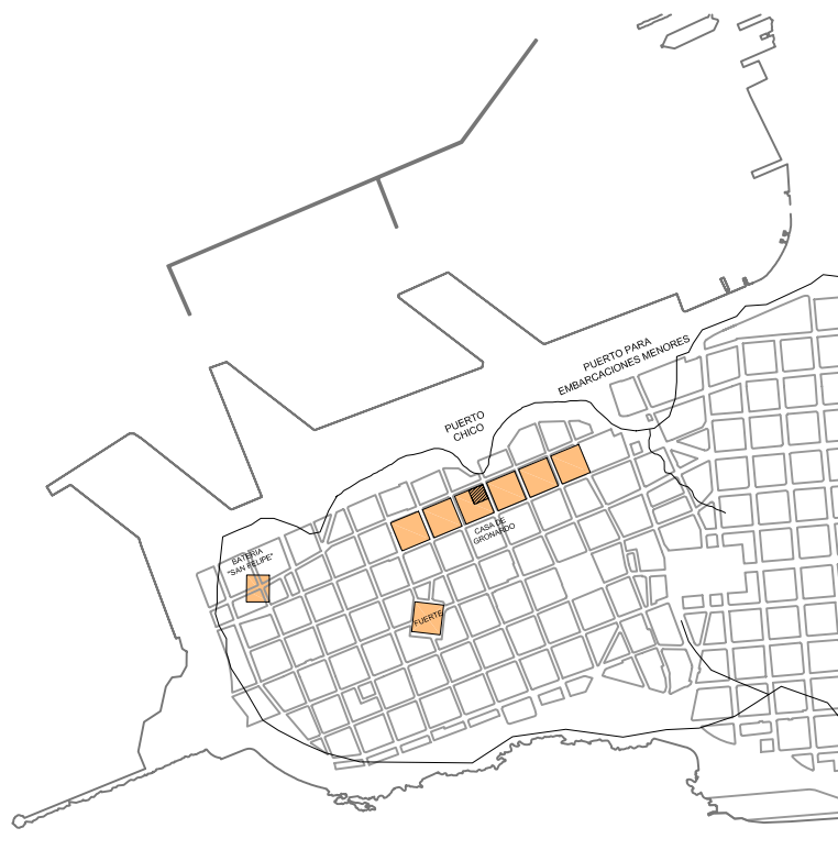
1724 AUTOR: FRANCISCO PETRARCA, INTERPRETACIÓN: CARLOS PEREZ MONTERO PRIMERAS MANZANAS PROYECTADAS.