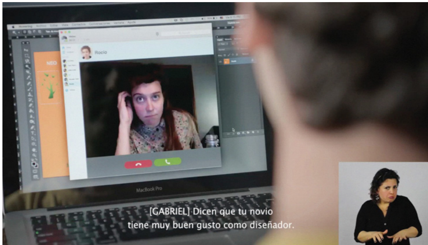
↑ Detalle de trabajo de accesibilidad audiovisual.