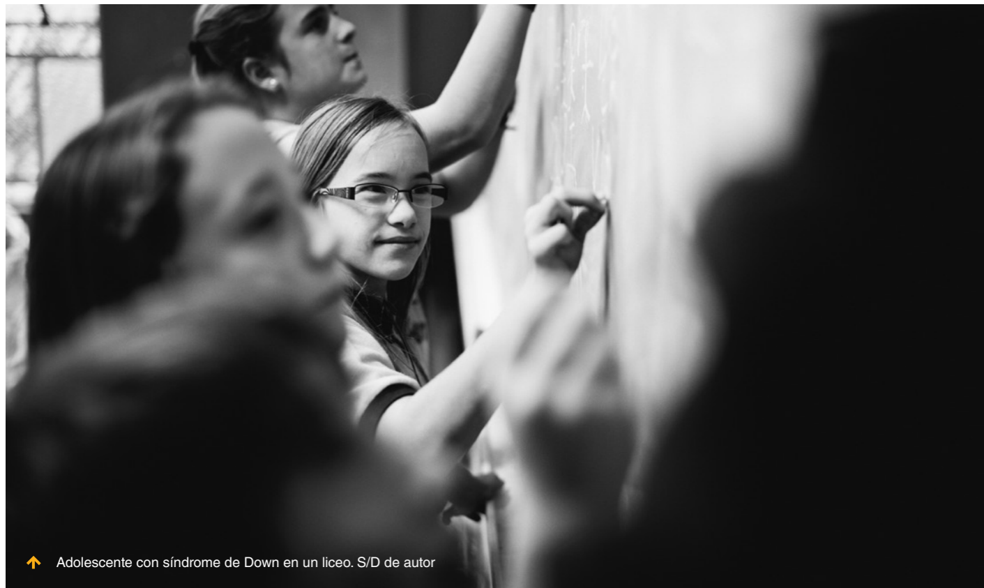
↑ Adolescente con síndrome de Down en un liceo. S/D de autor

Desde setiembre se desarrolla el III Congreso Nacional de Educación “Enriqueta y Compte y Riqué”, que tiene como objetivo obtener insumos para elaborar un Plan Nacional de Educación. Esas propuestas surgen de las opiniones recogidas en asambleas locales y departamentales donde participaron educadores, académicos, autoridades de la educación, estudiantes y ciudadanos interesados en el tema. Con documentos que sintetizan las opiniones y propuestas en estas asambleas es que se convocó, para comienzos de diciembre, a una sesión del Plenario Nacional del Congreso, donde se acordará un documento final. Las discusiones partieron de cuatro ejes: aportes para la elaboración de un Plan Nacional de Educación; democratización, universalización y educación de calidad; educación, diversidad y diversificación; y los desafíos de la educación.