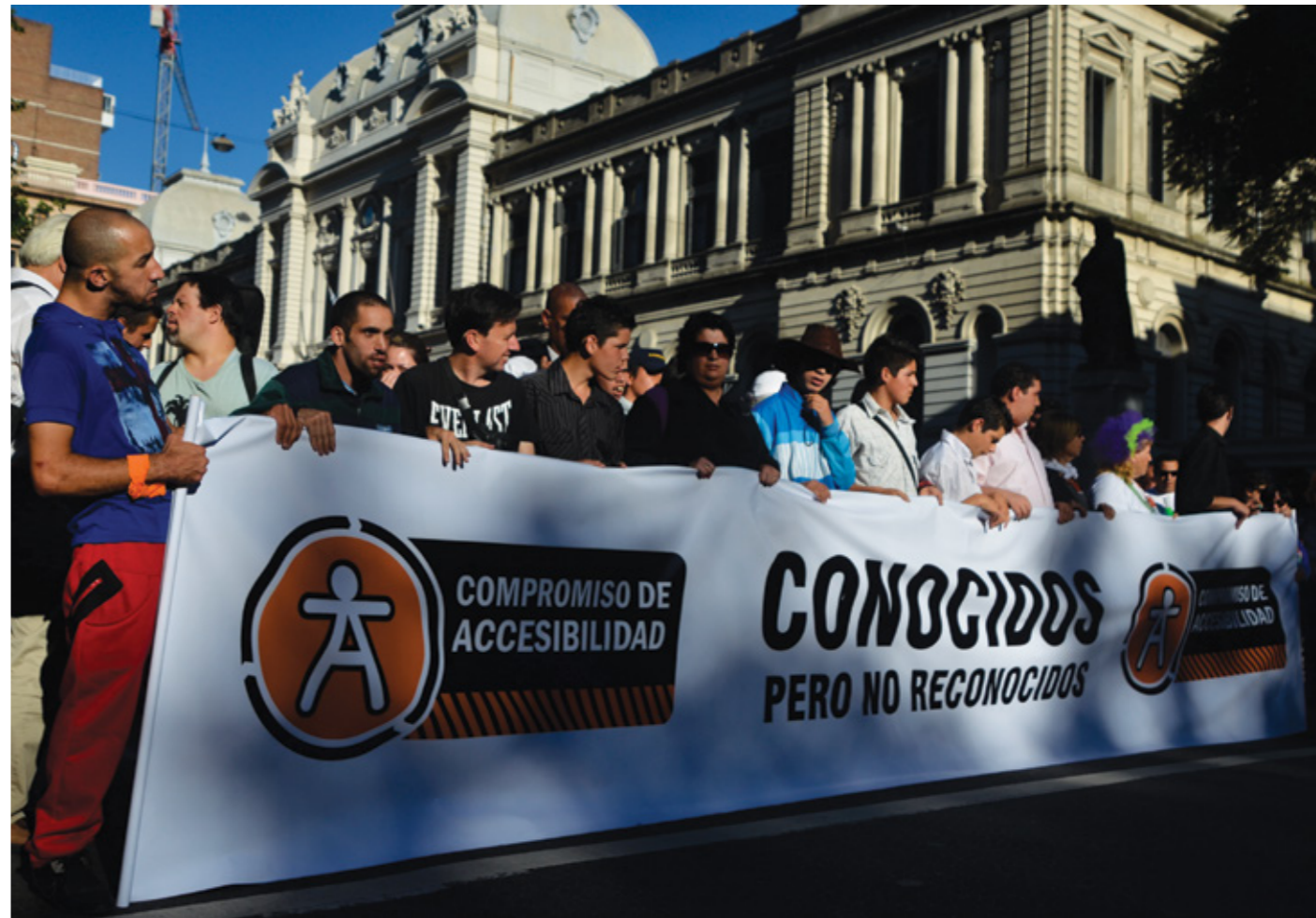
➤ Marcha por la Accesibilidad 2014.

La marcha busca coincidir con el festejo, en Montevideo, del Día Internacional de las Personas con Discapaci-