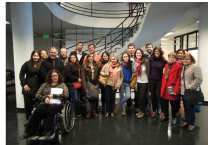
Reunión de organización de Montevideo sin barreras.

La muestra Montevideo sin barreras se desarrollará del 27 de noviembre al 1° de diciembre en el atrio de la Intendencia de Montevideo. Este año el público podrá apreciar diversos stands de instituciones que trabajan en el área de la discapacidad, además de participar en charlas, talleres y espectáculos.