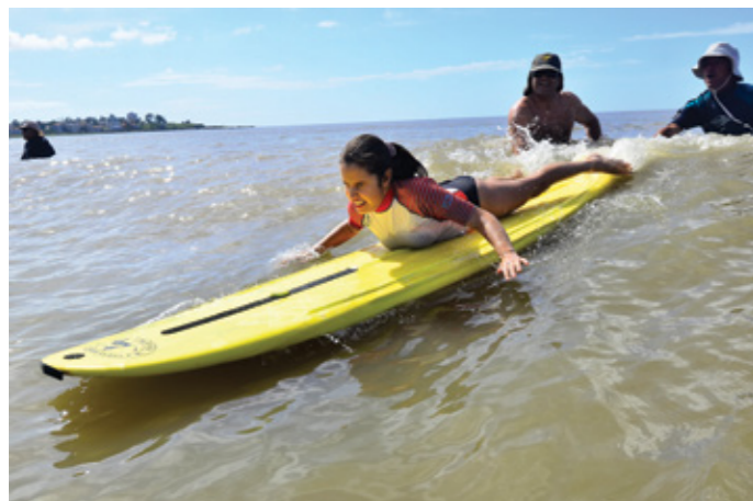
Surf inclusivo

El programa Verano de la Intendencia de Montevideo (IM) ofrece actividades recreativas y deportivas para personas con discapacidad en playas y clubes de la ciudad.