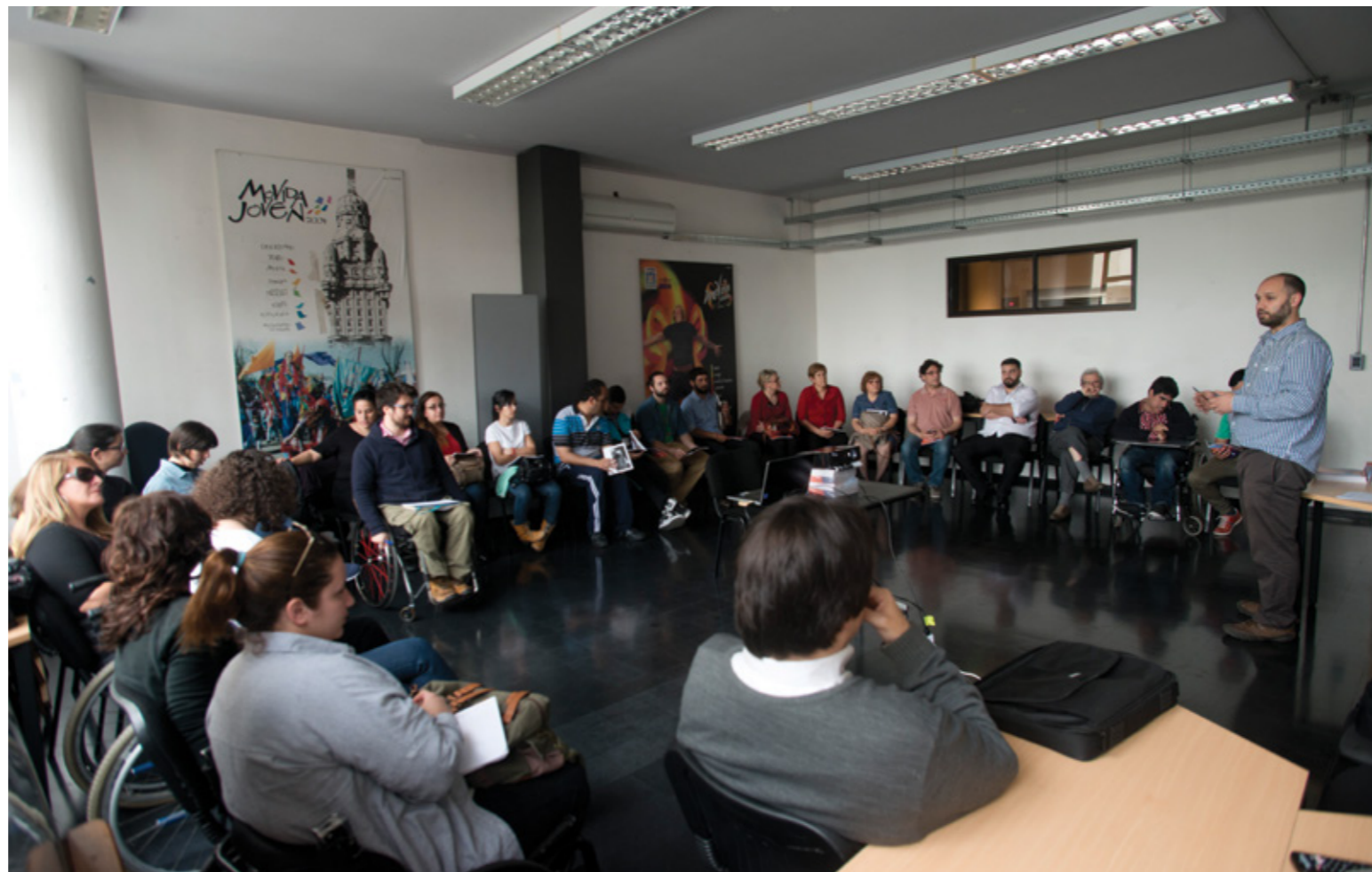
↑ Presentación del borrador del Primer Plan de Accesibilidad a organizaciones sociales de personas con discapacidad.

El Plan de Accesibilidad es una herramienta de gestión que pretende “marcar un cambio en el proceso de gestión de la IM en relación a las acciones para lograr la accesibilidad de la ciudad”, explicó Lezama. El plan permitirá “constatar de mejor manera las acciones que realiza la Intendencia en su conjunto, y también evaluar en qué medida se va implementando”, y “tener una dimensión de las relación entre los objetivos que se