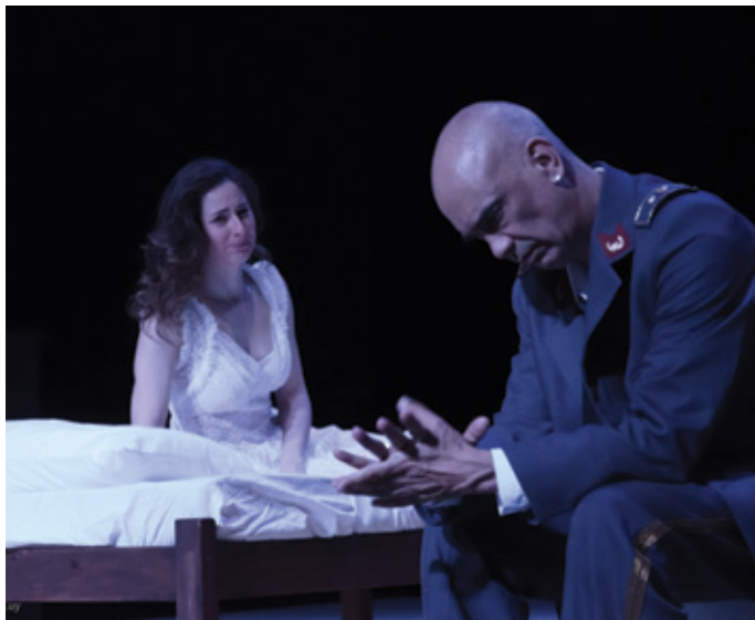
↑ Obra Otelo.